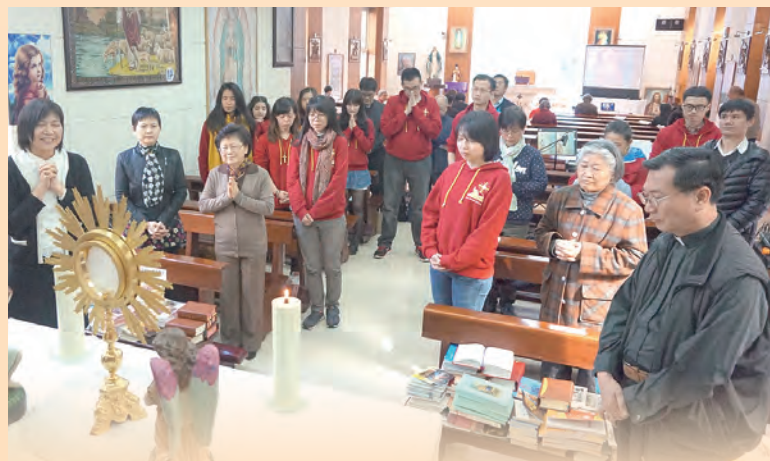
▲聖體敬禮薪火延續台北場培訓活動的服務志工們，先聚集作服事前的祈禱。