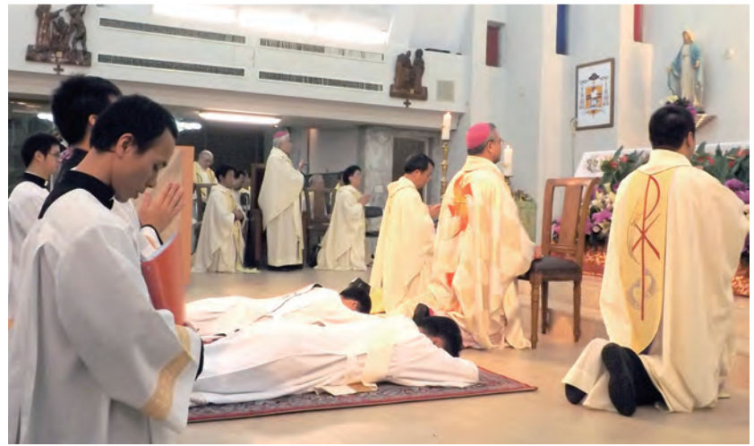
▲每當聖召結出果實，晉鐸大典是最動人的時刻。

我們祈求天主，賜與我們更多的聖召，讓更多年輕人勇敢地追隨祂！也請求聖母媽媽為我們轉禱，陪伴我們勇敢地答覆天主的邀請！祝大家有美好的一天。