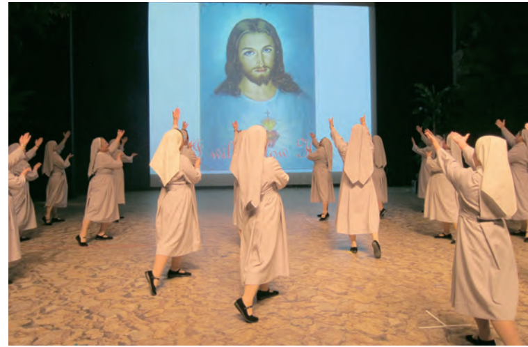
▲瑪爾大修會深耕本土聖召不遺餘力，以精彩活動豐富了聖召。