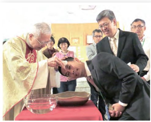
▲陳建仁副總統公務繁忙，仍擔任領洗者的代父，全心陪伴慕道者，直到進到主棧。 ▶聖家堂為數眾多的小朋友領洗，讓人看到教會未來希望。