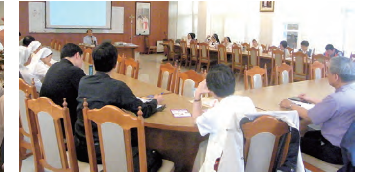
▲洪總主教為強化聖召培訓營，請神父作專題演講，神父、修女們認真進修。