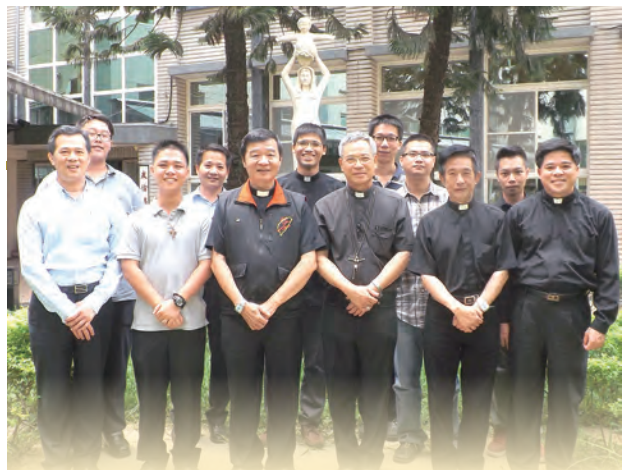
▲神長們用心培育聖召苗圃，也期許教友們用心為聖召祈禱。