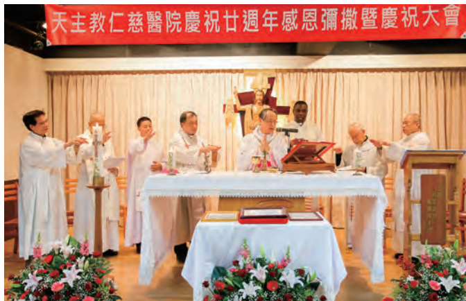
▲仁慈醫院20周年院慶感恩彌撒由李克勉主教主禮