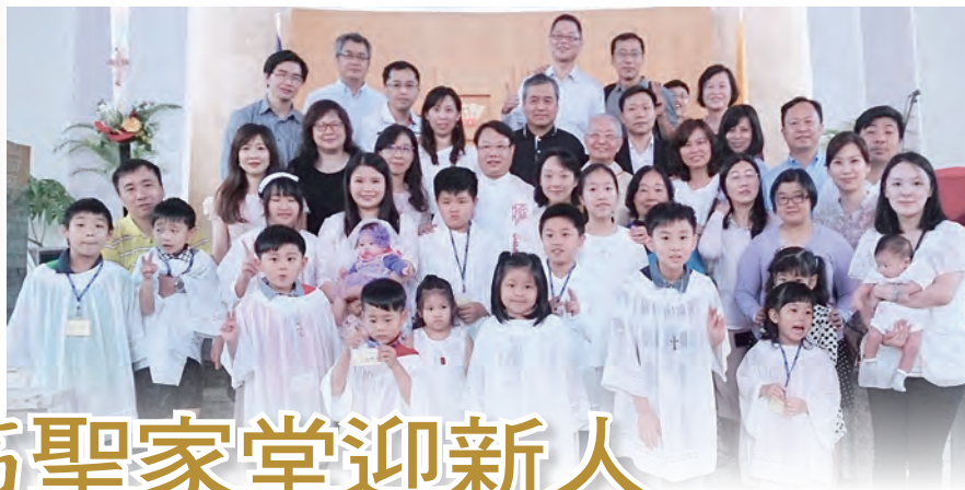
■文·圖片提供／劉鳳琴(台北聖家堂傳協會)