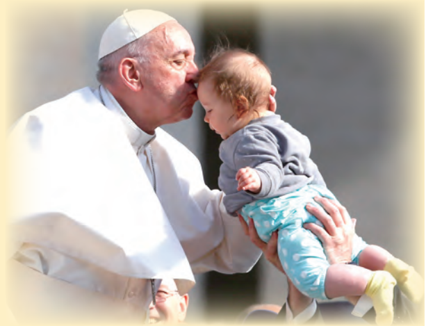
▲教宗4月26日公開接見時，在聖伯多祿廣場上親吻一名孩童的額頭，予以降福。

們必會感到失望和氣餒。事實上，世界偏愛自私的法則，甚於愛的法則，但耶穌所許諾的「我與你們天天在一起」，使我們立足於希望；信賴天主，正在實現人眼中似乎不可能的事。