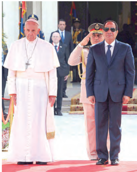
▲教宗方濟各4月28日抵達埃及首都開羅，在展開第18次國際牧靈訪問前，教宗先赴總統府拜會塞西總統（Abdel-Fattah Al-Sisi）。

【梵蒂岡電臺訊】教宗方濟各4月28日上午啟程前往埃及首都開羅，展開他的第18次國際牧靈訪問。他在去程的飛機上向記者們強調，「這是一次團結、友愛的訪問」，蘊含「一份特殊的期待」，因為他是應埃及總統、東正教科普特禮宗主教、天主教科普特禮宗主教和阿茲哈爾大伊瑪目之邀前去訪問的。