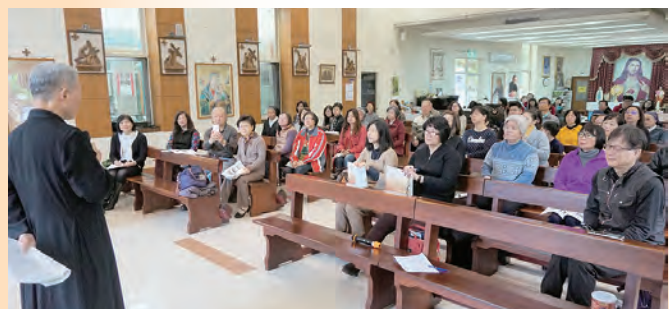
▲接受台北場聖體敬禮培訓的學員認真聽講

翻譯的《與教宗方濟各一起朝拜聖體》，是一本很好而且簡單易懂的書，教導我們如何朝拜聖體、在聖體前祈禱與默想！從聖言、與聖人、也與聖母一起，這讓我們更朝向耶穌真理的道路！教宗方濟各帶我們了解「朝拜聖體」的確有我們想不到的偉大力量！