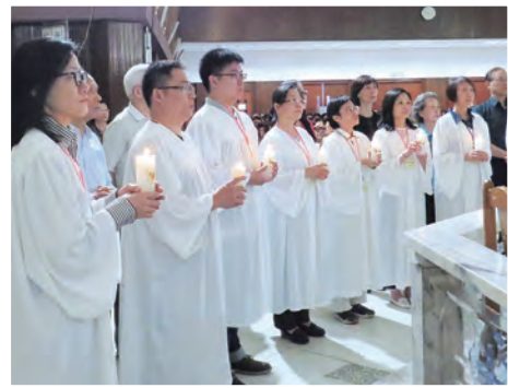
▲聖家堂在復活節前夕新領洗教友身穿白衣，手持白燭，親近主台前。

每一個與主相遇的人，都有不同的故事。當年保祿是在大肆迫害宗徒之後，因耶穌顯現給他，才開啟保祿信德的眼，讓他歸化為主作證。信仰這條路，雖然天主帶領每個人的方式都不一樣，但重要的是，在基督這個大家庭相會了。每個新朋友的故事都很動人，歡樂的時光總是過得特別快，迎新茶會在下午2時饒神父降福後結束，期待來年有更多的新朋友加入基督的大家庭，分享基督復活的喜悅。