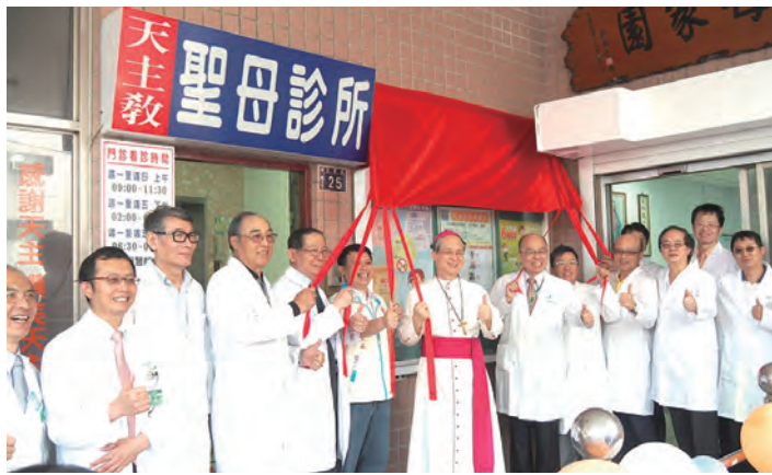
▲院慶當天，聖母診所舉行新湖社區醫療群揭牌儀式，雙喜臨門。