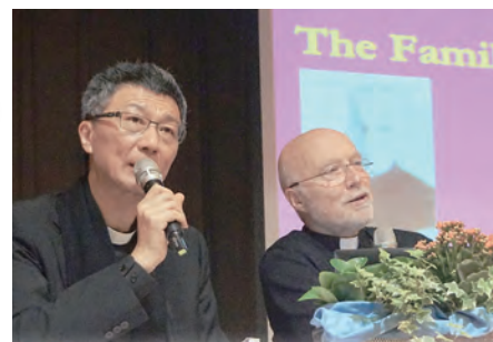
▲馬神父的精彩演講，陳科神父即席口譯。

講完後，他很得意地望向台下的姆姆，似乎享受著國際知名的諾貝爾和平獎得主被他的演講所征服；這時的姆姆也差不多念完玫瑰經，她微笑地對著台上的奧蒂嘉說：「愛的工作就是和平的工作。（Work of love is work of peace.）」這時的口譯員嚇得愣在那邊，不敢將姆姆的話翻譯出來，一旁的萊歐神父也緊張到不行，姆姆請旁邊的修女翻譯，那位修女帶著顫抖的聲音，囁嚅又口吃地把姆姆的話翻譯給奧蒂嘉聽；接著，姆姆問他有幾個孩子，奧蒂嘉回答：「7個」，於是姆姆從口袋掏出1個聖母顯靈聖牌遞給奧蒂嘉，說：「這個給老大。」奧蒂嘉在台上向姆姆彎下腰接下聖牌，姆姆又再掏出第2個顯靈聖牌說：「這個給老二。」奧蒂嘉又彎腰接下第2個，如此來來回回同樣的動作，給了7個聖牌後，又拿出第8個送給他太太，第9個給奧蒂嘉本人；而奧蒂嘉在1979年的秘