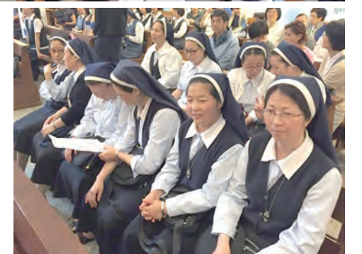
▲修女們歡喜參與活動，分享答覆聖召的故事。