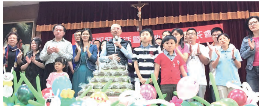
▲聖家堂的慕道者都經過紮實的主日學課程，及教友們的悉心陪伴。