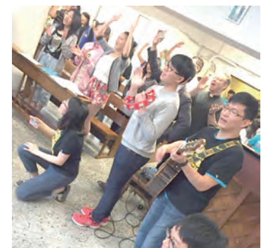
▲年輕人在國際聖召節熱情奉獻自己的才華，使活動辦得有聲有色。

祈禱的機會，因為耶穌也說過：「我實在告訴你們：若你們中二人，在地上同心合意，無論為什麼事祈禱，我在天之父，必要給他們成就，為那裡有兩個或三個人，因我的名字聚在一起，我就在他們中間。」(瑪18:19-20)這也可幫助我們，不只是在共同祈禱中得到力量，更在家人共同祈禱中來尋求天主旨意。其次，主日到聖堂參加彌撒後，不要急著離開，多與神父聊聊，深入地認識神父的工作，不是只有在祭台上的那一刻，雖說每日舉行彌撒、祈禱都是神父每日必做的本分工作，但這僅是其中的一小部分，若能夠對神父的工作有深入的認識，就會明瞭神父是如何在每天的生活中答覆天主的召喚。