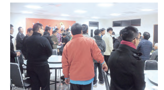
▲在台灣總修院學舉辦的聖召營，吸引有志追隨主的青年來體驗。

祈禱的機會，因為耶穌也說過：「我實在告訴你們：若你們中二人，在地上同心合意，無論為什麼事祈禱，我在天之父，必要給他們成就，為那裡有兩個或三個人，因我的名字聚在一起，我就在他們中間。」(瑪18:19-20)這也可幫助我們，不只是在共同祈禱中得到力量，更在家人共同祈禱中來尋求天主旨意。其次，主日到聖堂參加彌撒後，不要急著離開，多與神父聊聊，深入地認識神父的工作，不是只有在祭台上的那一刻，雖說每日舉行彌撒、祈禱都是神父每日必做的本分工作，但這僅是其中的一小部分，若能夠對神父的工作有深入的認識，就會明瞭神父是如何在每天的生活中答覆天主的召喚。