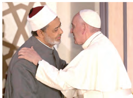
▲教宗方濟各4月28日訪問阿茲哈爾大學，受到大伊瑪目塔伊布（Ahmad al-Tayeb）的真摯熱情的歡迎。

為建設和平及防止衝突，基本重要的工作在於消除極端主義最容易扎根的貧窮和剝削情況，堵住向煽動暴力者提供金錢和武器的管道。更為根本的是，