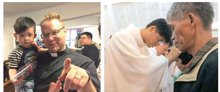
▲聖召培育有成，深深感謝神父的父母親奉獻出自己最愛的兒子給天主。