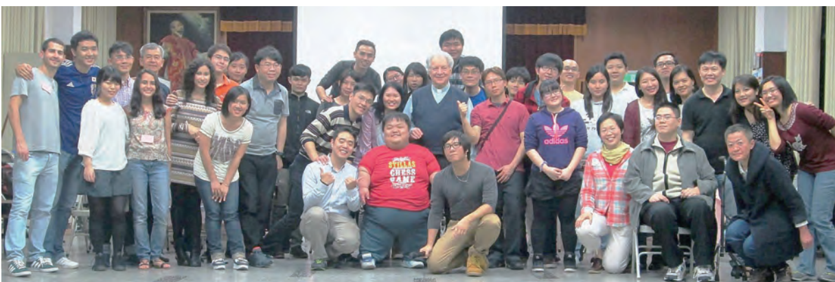
◀陪伴聖家堂青年團

聖召影片： https://www.facebook.com/JesuitVocation/videos/vb.100015884886022/139782023227960/?type=2&theater