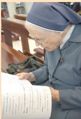
▲高齡修女也全程參與，認真研讀禱文。