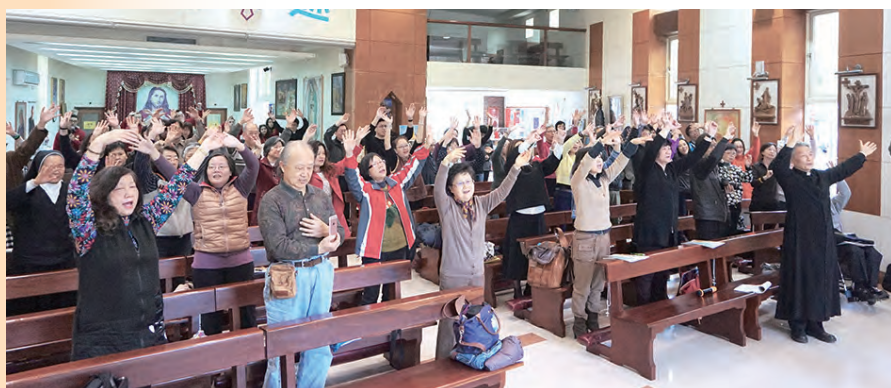
▲敬拜讚美的聖歌帶動唱，揭開培訓活動的序幕。

這位偉大的天主更是慈悲的父親，因人子降生正是祂慈悲的同在，祂給予我們相同的使命，也要我們「彼此相愛」，「活出慈悲、活出愛」就是基督徒的使命，而明供聖體無疑地是我們充電的來源，因為「明供聖體」就是「感恩（聖體）聖事」的延伸；在聖體前的靜默與謙卑，讓我們能真實聆聽聖言餵養我們的「雙胞胎／靈魂」，這是為了讓我們更活出如同加爾各答聖德蘭姆姆的慈悲精神；在聖體聖事內就是一個愛的聖事與愛的交流！