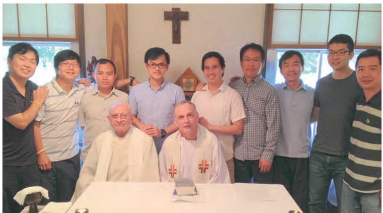
▲去日本接受培育課程