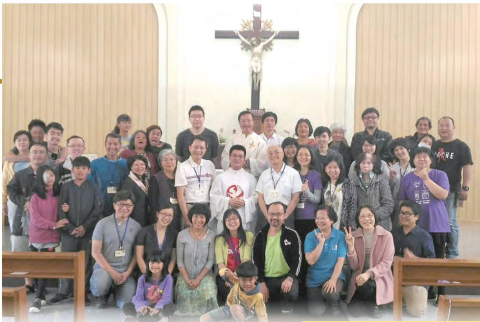
▲Choice靜心城堡的參與者與香山天主堂教友合影 ▶壞脾氣的鸚鵡（自我覺察整合領悟）