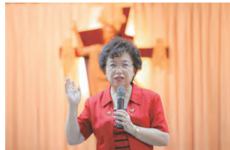
▲江綺雯監委分享她的視察工作並予以鼓勵

張院長致詞說：仁慈醫院20歲了，在軟硬體上也有突破，除了門診1樓大廳和7樓病房的煥然一新，同時努力為失智長者及安寧病患深耕社區服務。感謝李主教的支持、指導，更感謝天主的