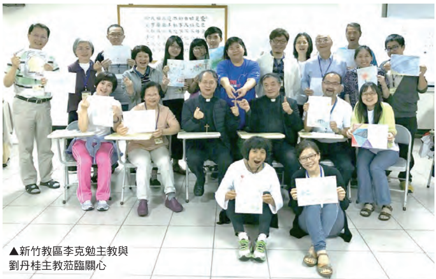
▲新竹教區李克勉主教與劉丹桂主教蒞臨關心